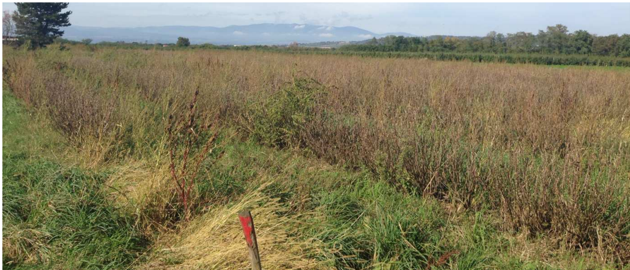
1. Vue depuis la frange est de la zone projet. – ( RD 453) Les terrains sont actuellement en culture