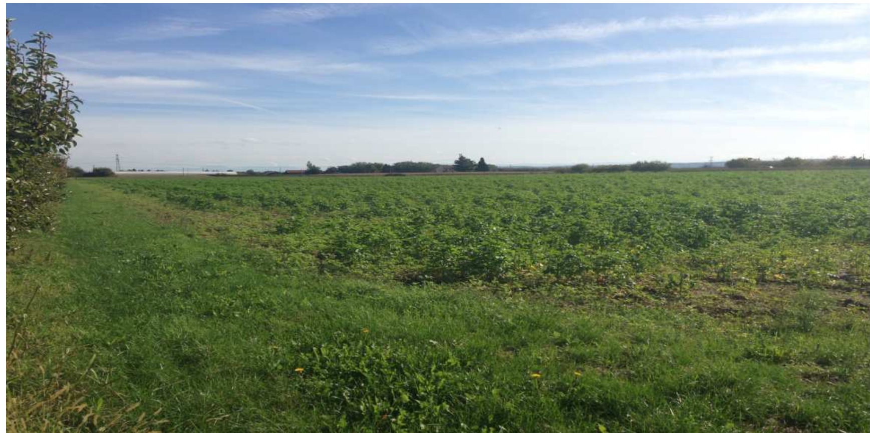
2. Vue vers l'est (RD 453) depuis la frange ouest -