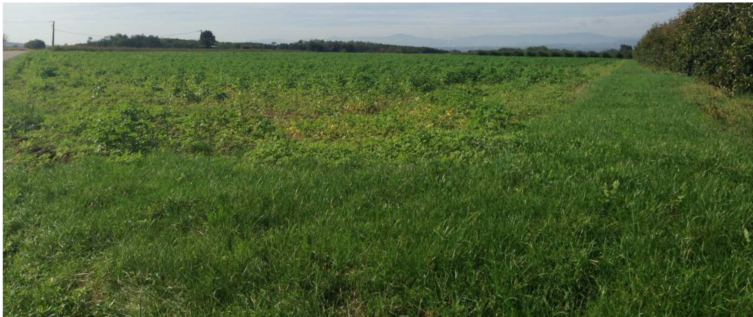
3. Vue vers le sud depuis la frange est (long de la RD453) du projet